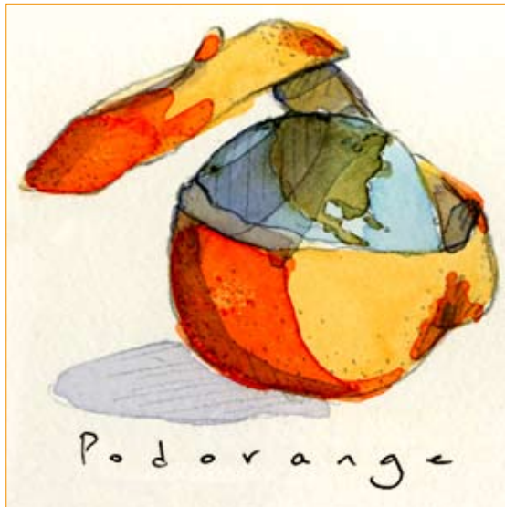
Image du Podcast dans iTunes