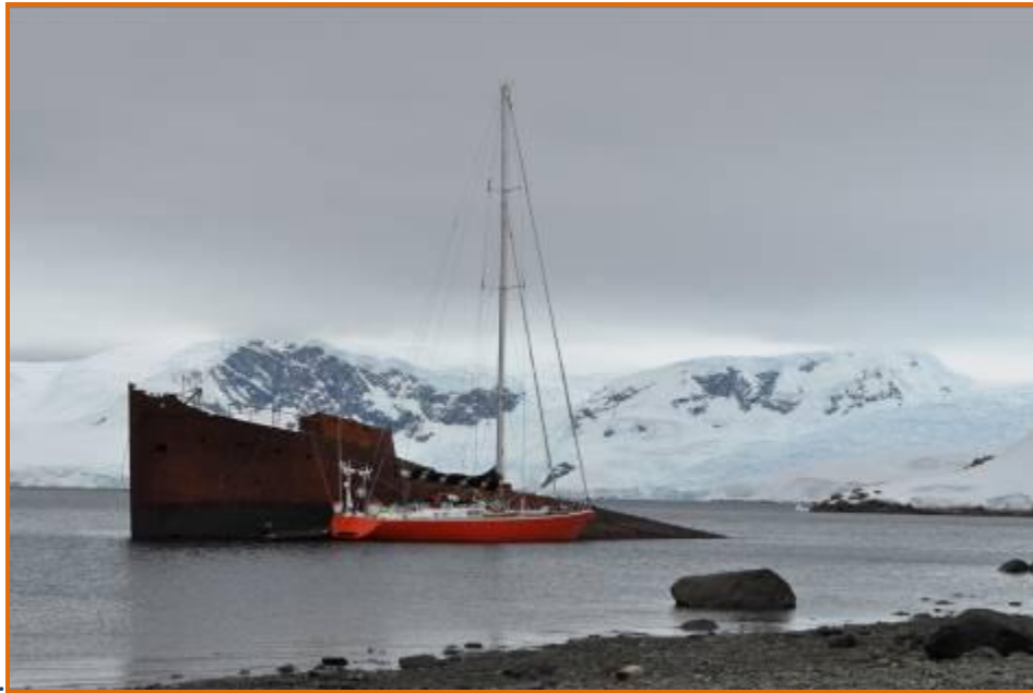
Mouillage en toute sécurité le long de l'épave Enterprise (voir page précédente)