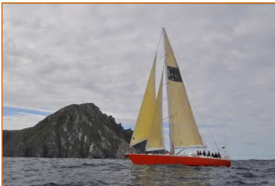
Podorange au Cap Horn, une émotion vive après le passage de Drake !

Traversée du passage de Drake. Le soir du 4 e jour, nous atteignons le Cap Horn. Si les conditions le permettent, nous mouillons dans un mouillage protégé de l'archipel des Wollaston ou à Puerto Williams. La soirée au Micalvi, le mythique bar de Puerto Williams, est souvent l'occasion de conclure de belle manière notre voyage !