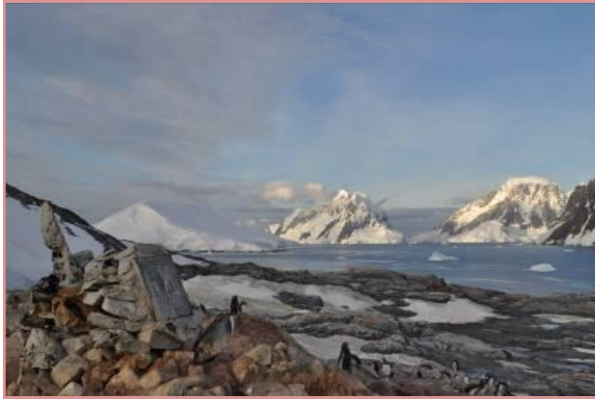
Au premier plan, la stèle de l'expédition Pourquoi pas ? sur l'île Booth. Au fond, le détroit de Lemaire

L'île Petermann doit sa notoriété à Charcot qui revint pour un second hivernage mais cette fois a bord du Pourquoi Pas ? En 1909. C'est également l'endroit où évolue une colonie de manchots Adélie au milieu des manchots Papous. L'île est un paradis pour la faune. Quant au paysage, il est toujours aussi saisissant : le détroit de Penola, qui sépare l'île de la Péninsule, complètement pris par les glaces, forme une sorte de banquise chaotique. A l'est, la chaîne de montagnes qui borde la Péninsule complète ce tableau enchanteur.