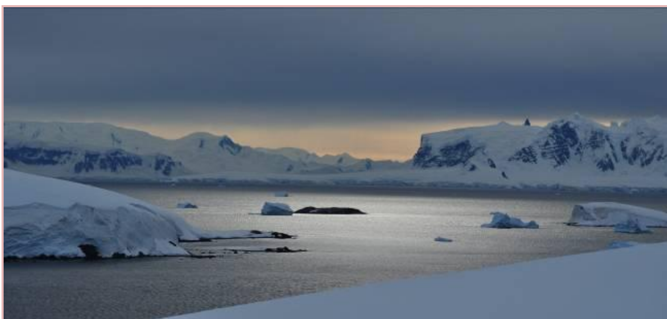
Détroit de Gerlache vue depuis l'île Enterprise

Nous longeons l'île Brabant, couronnée par le Mont Parry (2520m), passons à côté de la très spectaculaire île Lecointre, puis rejoignons notre premier mouillage : Enterprise au nord de l'île Nansen.