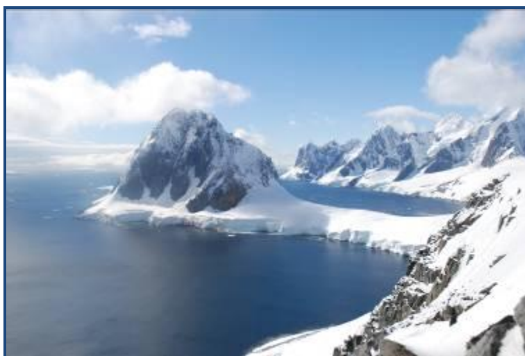
Détroit de Lemaire vu depuis l'île Booth

Cap toujours plus au sud, en direction du détroit de Lemaire, un des sites les plus spectaculaires de la Péninsule. Le paysage (des parois rocheuses de plusieurs centaines de mètres qui tombent dans la mer) est impressionnant. La navigation dans le détroit est difficile car celle-ci est souvent encombrée par les glaces. Le soir, si tout va bien, nous atteignons l'île Petermann.