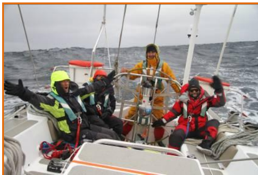
Quart de jour sur Podorange lors d'une expé ski-voile, les montagnards veillent au grain !